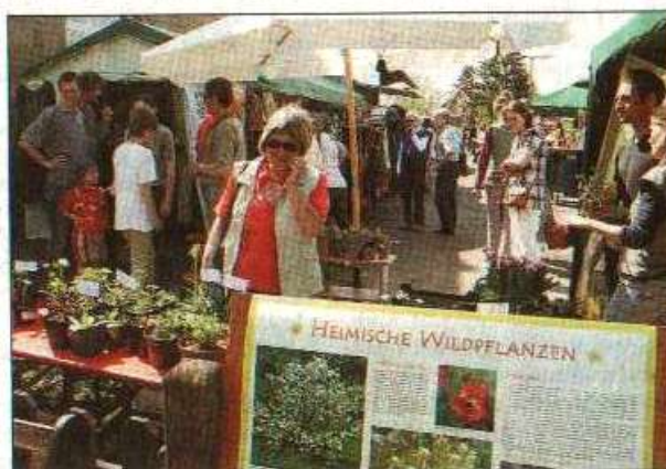
Viele aufmerksame Besucher fand der Frühlingsmarkt beim ehemaligen Maulbronner Stadtbahnhof.

Die Veranstaltung begann um 11 und endete gegen 19 Uhr. Es wurde ein vielseitiges Angebot rund um das Thema „Natur“ gezeigt. Von ökologischer Kleidung über handgefällte Accessoires, Nistkästenbau, Pflanzen- und Kräuterauswahl biologischen Anbaus, Schmuck, Keramik bis hin zu Schafmilchprodukten gab es ein vielseitige Präsentation. Ebenso war ein kulinarisches Angebot aus leckeren ökologischen Produkten zu genießen und ein nettes Bahnhscafé