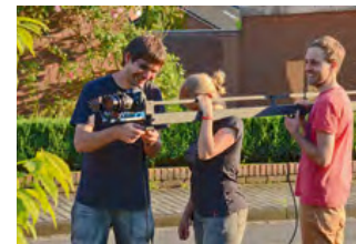
... und auch unser Team hat seinen Spaß