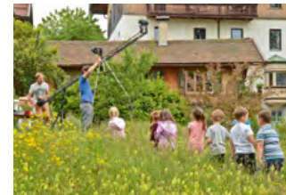
Voller Begeisterung toben die Kinder in ihrem Natur-Erlebnis-Kindergarten Tegernsee für unsere Filmaufnahmen ...