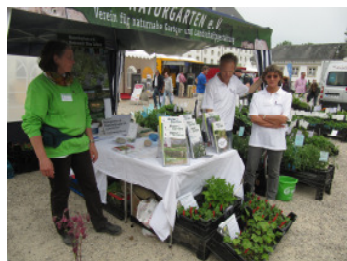
Infostand Schleswig mit neuen Shirts